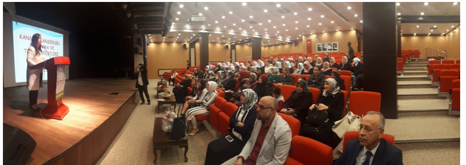
Sincan Lale Konferans Salonu

mümkün olabilmektedir. Mevzu hastalık mevzu kanser olduğunda bilgi eksikliği, korku, ihmal gibi nedenlerle insanlar zamanında hekime başvuramamakta; böylece tanı gecikmekte, tedavi de güçleşmektedir. Bunun için yapılması gereken; kansere yakalanmadan bunu sağlayacak en önemli ... Devamı sayfa 2'de